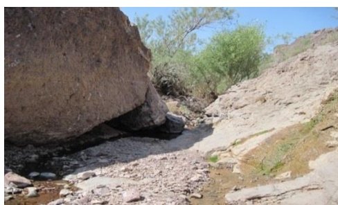
شکل ۶. ایستگاه قنات در روستای کوران (شهرستان فردوس)، زیستگاه B. oblongus