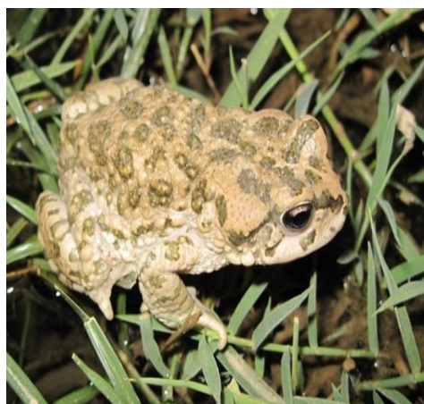
شکل ۴. جنس ماده Bufo oblongus