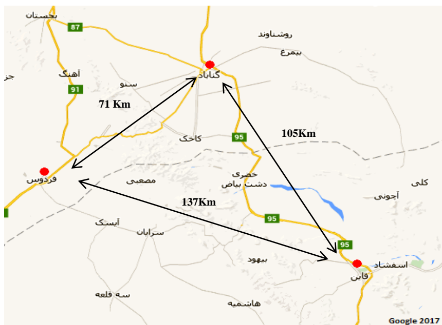
شکل ۱. شکل دایره، شهرستان‌های مورد مطالعه در این تحقیق همراه با فاصله مکانی

معمولی استاندارد، اندازه‌گیری شد. تمامی نمونه‌های بالغ، در شب و با کمک دست جمع‌آوری شدند. نمونه‌های نابالغ، در درون فرمالین پنج درصد و انواع بالغ پس از کشته شدن توسط کلروفرم و تزریق فرمالین در داخل بدن، داخل فرمالین ده درصد تثبیت شدند. شناسایی نمونه‌ها با کمک منابع معتبر و با کمک صفات ریختی انجام شد (Baloutch & Kami, 1995). به منظور بررسی شیب تغییرات ریختی حاصل از دگردیسی لارو این گونه، تعداد هشت صفت و برای مطالعه صفات