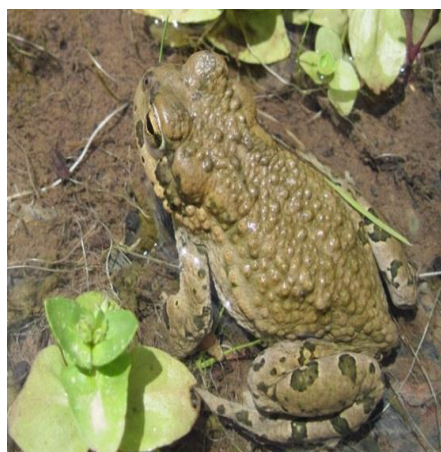
شکل ۳. جنس نر Bufo oblongus