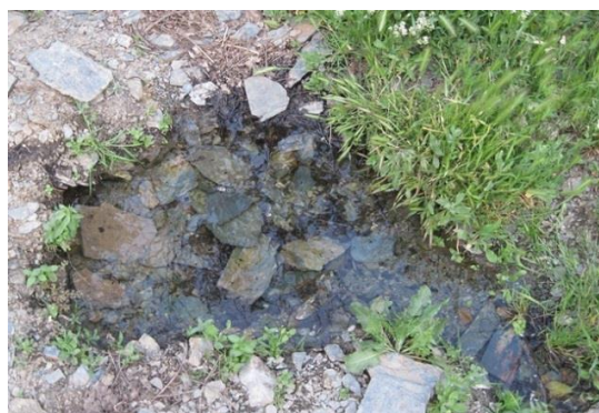
شکل ۸. چشمه فصلی (روستای مهوید)، محل تخم‌ریزی B. oblongus

در مطالعه ریختی نمونه‌های بالغ، بیشترین طول به دست آمده برای این گونه، ۸/۲۷ سانتی‌متر برای جنس ماده (از ایستگاه قنات بَلَدَه باغستان علیا، شهرستان فردوس) و کمترین طول به دست آمده به میزان ۵/۵۹ سانتی‌متر مربوط به جنس نر (از ایستگاه قنات قَصَبَه، شهرستان گناباد) بود. دیگر نتایج به دست آمده از مطالعه ریختی این گونه، در جدول ۶ نشان داده شده است. نسبت طول ساق پا به اندازه بدن (T/L)، بین ۰/۳۱ تا ۰/۳۸ متغیر بود؛ این نسبت در جنس‌های ماده و نر، تفاوت اندکی نشان می‌داد (۰/۳۴). برای هفت وزغ ماده و ۰/۳۵ برای هفت وزغ نر. به طور میانگین، این نسبت برای نمونه‌های مورد مطالعه