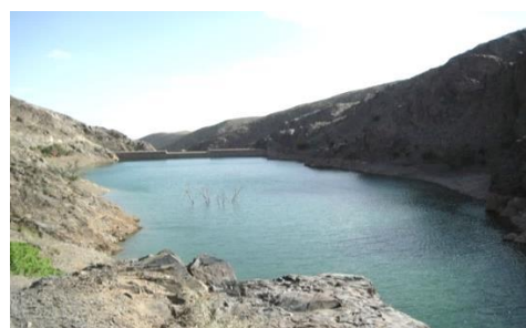
شکل ۵. ایستگاه سد در روستای مهوید (شهرستان فردوس)، زیستگاه B. oblongus