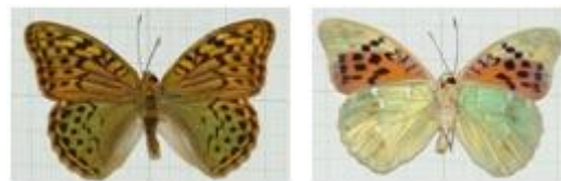
تصویر ۲. ♂ Argynnis pandora

مشخصات جنس نر: طول بال جلو ۳۲-۳۷ میلی‌متر، بال‌ها با زمینه سبز مایل به نارنجی، قاعده بال جلو سبز، سطح زیرین بال جلو با زمینه قرمز آجری تا قرمز تیره، نیمه رأسی زرد روشن، تمام لکه‌های سیاه در نیمه رأسی غایب، زمینه زیر بال عقب سبز روشن، ناحیه S7 و انتهای حجره (انتهای سلول دیسکوئیدال) دارای دو لکه نقره‌ای درخشان و V شکل، زیر بال عقب با یک نوار باریک نقره‌ای از حاشیه پیشین تا حاشیه داخلی، بندرت کامل، اغلب در وسط شکسته (تصویر ۲). جنس نر این گونه به تعداد ۲ نمونه در ۸۹/۴/۱۰ از کدیر و ۱ نمونه در ۸۹/۵/۲ از نسن جمع‌آوری و شناسایی گردید.