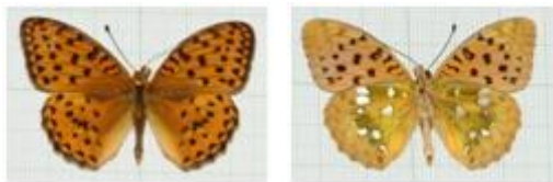
تصویر ۴. ♂ Argynnis alexandra

Argynnis alexandra (MENETRIES, 1832) مشخصات جنس نر: طول بال جلو ۲۵-۳۲ میلی‌متر، بال‌ها با زمینه نارنجی-قهوه‌ای، خال S4 در ردیف زیرحاشیه‌ای هر دو بال کوچکتر از سایر خال‌ها، حاشیه خارجی دارای دو ردیف خال‌های سیاه، سطح زیرین بال جلو در حاشیه پیشین و رأس زرد نخودی و مات، بال عقب در قاعده با غبار قهوه‌ای و کرک‌های ظریف، سطح زیرین بال عقب با زمینه زرد نخودی و خال‌های نقره‌ای درخشان، پراکنده و در اندازه‌های مختلف (تصویر ۴). جنس نر این گونه به تعداد ۱ نمونه در ۸۹/۴/۱۹ از کدیر جمع‌آوری و شناسایی گردید.