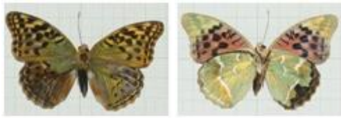
تصویر ۳. ♀ Argynnis pandora

Argynnis alexandra (MENETRIES, 1832) مشخصات جنس نر: طول بال جلو ۲۵-۳۲ میلی‌متر، بال‌ها با زمینه نارنجی-قهوه‌ای، خال S4 در ردیف زیرحاشیه‌ای هر دو بال کوچکتر از سایر خال‌ها، حاشیه خارجی دارای دو ردیف خال‌های سیاه، سطح زیرین بال جلو در حاشیه پیشین و رأس زرد نخودی و مات، بال عقب در قاعده با غبار قهوه‌ای و کرک‌های ظریف، سطح زیرین بال عقب با زمینه زرد نخودی و خال‌های نقره‌ای درخشان، پراکنده و در اندازه‌های مختلف (تصویر ۴). جنس نر این گونه به تعداد ۱ نمونه در ۸۹/۴/۱۹ از کدیر جمع‌آوری و شناسایی گردید.