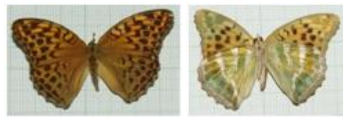
تصویر ۱. ♀ Argynnis paphia

مشخصات جنس ماده: طول بال جلو ۳۶-۳۸ میلی‌متر، خال‌ها و لکه‌های سیاه تماماً گسترده و مشخص، در بال جلو سایه سیاه S9 مشخص و بزرگ، سطح زیرین بال عقب با زمینه سبز مات تا سبز چرک همراه با نوارهای عرضی نقره‌ای، دو نوار کوتاه قاعده‌ای و دو نوار کامل در وسط بال و حاشیه خارجی (تصویر ۱). جنس ماده این گونه به تعداد یک نمونه در ۱۳۸۹/۴/۱۱ از گلندرود جمع‌آوری و شناسایی گردید.