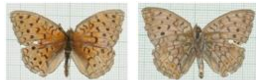
تصویر ۶. Argynnisniobe ♂

مشخصات جنس نر: طول بال جلو ۲۹-۲۳ میلی‌متر، بالهای با زمینه روشن قهوه‌ای - نارنجی، حجره با ۳ خط موج درونی، ناحیه زیرحجره‌ای با یک ردیف زیگ‌زاگ از لکه‌های سیاه چهارگوش، خال S4 معمولاً تحلیل‌رفته، قاعده و حاشیه داخلی بال عقب با غبار تیره و موهای ظریف روشن، حجره با یک لکه ۸ مانند شکسته و یک نقطه سیاه گرد قاعده‌ای، خال‌های S4 و S6 معمولاً تحلیل‌رفته یا غایب (تصویر ۶). جنس نر این گونه به تعداد ۱ نمونه در ۸۹/۳/۲۸ از بلده، ۱ نمونه در ۸۹/۴/۱۷ از کمربن، ۱ نمونه در ۸۹/۴/۱۷ از نسن و ۱ نمونه در ۸۹/۵/۲ از کدیر جمع‌آوری و شناسایی گردید.