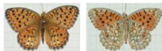
تصویر ۷. Argynnisniobe ♀

مشخصات جنس ماده: طول بال جلو ۳۰-۲۴ میلی‌متر، شبیه به جنس نر، زمینه بال‌ها کم‌رنگ و با لکه‌های سیاه درشت‌تر، سطح زیرین بال عقب تیره‌تر، خال‌ها مشخص، قاعده بخش زیرحجره‌ای گاهی به رنگ سبز یا زیتونی تیره، سایر مشخصات شبیه به جنس نر (تصویر ۷). جنس ماده این گونه به تعداد ۱ نمونه در ۸۹/۴/۱۷ از نسن جمع‌آوری و شناسایی گردید.