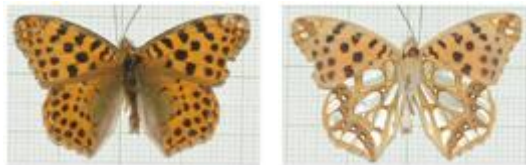
تصویر ۸. Issorialathonia ♂

مشخصات جنس نر: طول بال جلو ۲۵-۱۷ میلی‌متر، بالها با زمینه قهوه‌ای - نارنجی و خالهای سیاه فراوان، حاشیه خارجی هر دو بال معمولاً تیره، حاشیه بال جلو از V5 به بعد مقعر، ناحیه زیرین رأس بال جلو دارای ۲ الی ۴ لکه نقره‌ای براق، حاشیه خارجی بال عقب در V8 زاویه‌دار، تمام بال عقب پوشیده از لکه‌های درشت و براق نقره‌ای با حاشیه‌های تیره‌تر (از ویژگی‌های این پروانه) (تصویر ۸).