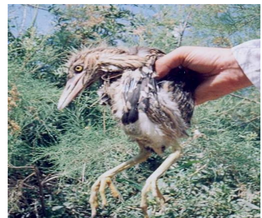
شکل ۳. جوجه‌های حواصیل شب در مرحله لانه‌گزیزی- دوره‌ای که کرک‌های بدن از بین‌رفته و پرهای جدید شروع به رشد نموده و جوجه قادر به پرواز نیست ولی می‌تواند از آشیانه حرکت نموده و در محدوده‌های اطراف آشیانه جابه‌جا شود- جوجه‌های ۱۵-۲۵ روزه

از میان ۹۱ تخم در ۳۰ آشیانه، ۵۸ تخم (۶۳/۷۳٪) تفریخ شد و از این تعداد ۴۵ جوجه (۴۹/۴۵٪) مرحله لانه‌نشینی را پشت سر گذاشتند و تنها ۴۱ جوجه (۴۵/۰۵٪) با عبور از مرحله لانه‌گزیزی به سن پرواز رسیدند. میزان موفقیت زادآوری به‌عنوان میانگین موفقیت در سه مرحله زادآوری معادل ۵۲/۷۴٪ محاسبه گردید. بیشترین موفقیت زادآوری در حواصیل شب ۶۲/۲۲ درصد در دستجات ۵ تخمی بوده است (شکل ۵). بر مبنای نتایج آزمون کروسکال والیس اختلاف معنی‌داری میان موفقیت در مراحل مختلف زادآوری حواصیل شب وجود نداشته است ( P > 0/05 ). موفقیت در مراحل لانه‌نشینی و لانه‌گزیزی به‌ترتیب برای گروه‌های همزاد یک جوجه‌ای ۷۶/۸۶٪ و ۹۰٪ و برای گروه‌های همزاد دو جوجه‌ای ۷۵/۵۵٪ و ۹۱/۱۱٪ محاسبه گردید. بر اساس نتایج آزمون