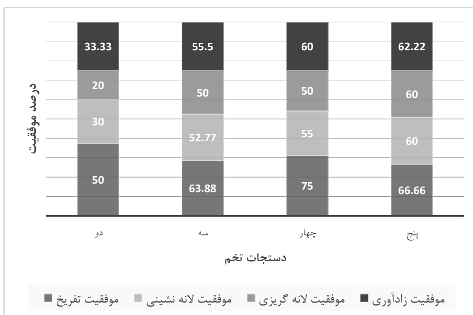
شکل ۵. اثر دستجات مختلف تخم روی موفقیت در مراحل مختلف زادآوری حواصیل شب در جزیره علی سیاه رودخانه کارون

تلفات در مراحل مختلف تولید مثل حواصیل شب بیشترین تلفات در مرحله قبل از تفریح و به میزان