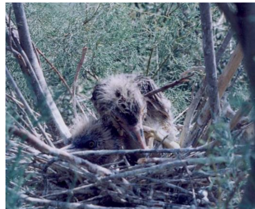
شکل ۲. جوجه‌های تازه تفریخ‌شده حواصیل شب در مرحله لانه‌نشینی در جزیره علی سیاه- دوره‌ای که جوجه تازه تفریخ‌شده و بدن آن کرکی است و قادر به حرکت در آشیانه نمی‌باشد- جوجه‌های کمتر از ۸ روزه.

نتایج این مطالعه نشان می‌دهد در حواصیل شب از ۹۱ تخم مورد بررسی در ۳۰ آشیانه، ۵۸ تخم تفریخ شده و از این تعداد ۲ گروه همزاد شکل گرفت که بیشترین آن گروه همزاد با یک جوجه (فراوانی ۳۴ جوجه) و کمترین آن گروه همزاد با دو جوجه (فراوانی ۱۲ جوجه) بوده است.