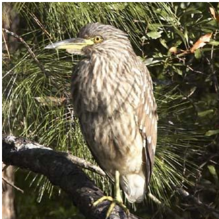
شکل ۴. جوجه حواصیل شب در آستانه پرواز- دوره‌ای که جوجه پرواز نموده و آشیانه را ترک می‌کند- ۲۵ > روزه