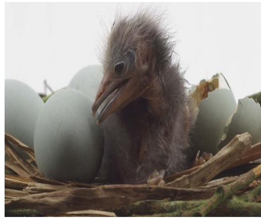
شکل ۱. تخم و آشیانه حواصیل شب در جزیره علی سیاه

نتایج این مطالعه نشان می‌دهد در حواصیل شب از ۹۱ تخم مورد بررسی در ۳۰ آشیانه، ۵۸ تخم تفریخ شده و از این تعداد ۲ گروه همزاد شکل گرفت که بیشترین آن گروه همزاد با یک جوجه (فراوانی ۳۴ جوجه) و کمترین آن گروه همزاد با دو جوجه (فراوانی ۱۲ جوجه) بوده است.