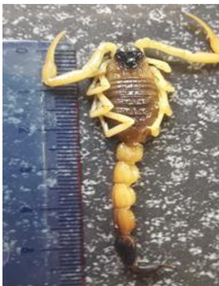
شکل ۴. نمای پشتی Hottentotta saulcyi

طول بدن بین هفت تا ۱۲ سانتی‌متر، نرها معمولاً کوچکتر از ماده‌ها، پدپالپ، سطح پشتی مزوزوما، سطح جانبی و شکمی متازوما و کیسه زهری پوشیده از مو، غده سمی، آخرین بند دم و بخش پیشین کاراپاس و کلیسرها سیاه، پاها و انبرک، سطح پشتی و شکمی مزوزوما و متازوما، زرد روشن یا تیره (شکل ۴). کارن‌های شکمی بند سوم و چهارم دم تیره هستند. فمور پدپالپ دارای پنج کارن و پاتلا دارای چهار تا هشت کارن می‌باشد. ردیف دندانی انگشت متحرک انبرک، ۱۴ تا ۱۶ ردیف و هر ردیف دارای گرانول فرعی داخلی و خارجی است. در زیر دندان انتهایی انگشت متحرک انبرک، چهار تا پنج گرانول مشاهده می‌شود. بند اول دم دارای ۱۰ کارن، بند دوم و سوم هشت تا ۱۰ کارن و بند چهارم دارای شش تا ۱۰ کارن و بند پنجم دارای سه کارن می‌باشد (Farzanpey, 1987; Dehghani, 2013; ) (Kovarik, 2009; Navidpour, 2012).