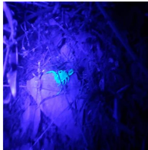
شکل ۳. خاصیت فلوروسانس عقرب در زیر نور ماورابنفش

پس از مشاهده عقرب، با کمک قیچی دندان موشی دسته بلند، آن را از ناحیه دم گرفته و درون ظروف محتوی الکل ۷۰ درصد قرار داده شد و مشخصات منطقه از قبیل مختصات جغرافیایی، ارتفاع محل، پوشش گیاهی، دمای هوا در دفترچه‌های مخصوص ثبت گردید. پس از شماره‌گذاری ظروف، نسبت به انتقال آنها به آزمایشگاه اقدام شد و با استفاده از استرئومیکروسکوپ مدل Olympus SZ-CTV و کلیدهای شناسایی نسبت به شناسایی گونه‌ها اقدام شد و با کمک کولیس ۱۲ صفت اندازی مطابق جدول ۲ به دست آمد. در نهایت جهت بررسی دو شکلی جنسی از آزمون تک‌متغیره T test نرم‌افزار Spss نسخه ۱۶ استفاده شد. این آزمون میانگین متغیرهای وابسته یک