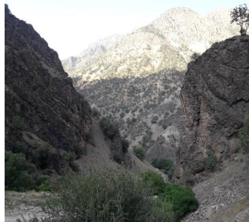
شکل ۲. منطقه دره رودبار