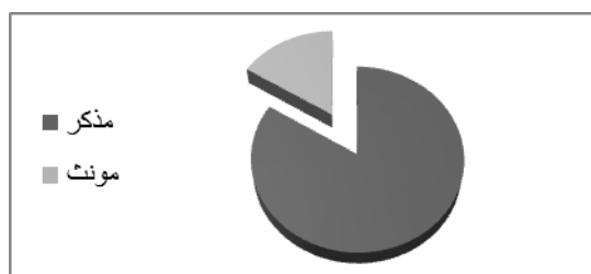
نمودار ۲. توزیع فراوانی آلودگی انگلی بر حسب جنسیت در در مراجعین به به آزمایشگاه مرکز بهداشت شهرستان گنبد کاووس در سال ۱۳۹۲