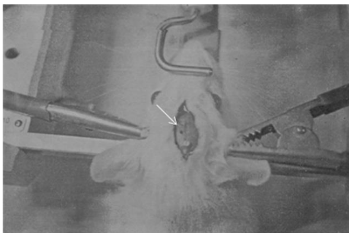
شکل ۱. محل تزریق دارو بداخل هسته شکمی میانی در مغز موش را نشان می‌دهد. فلش سفید بیانگر محل تزریق است.

نتایج گروه‌های درمانی این مطالعه نشان داد که SCH23390 (آنتاگونیست