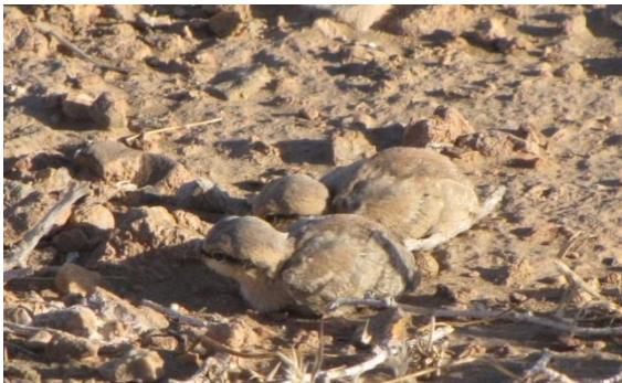
۲. جوجه تهیو (حالت استتار) منطقه حفاظت شده پروند (مسعود یوسفی)

شناسایی پرندگان زادآور در هر کشور ضروری و اجتناب‌ناپذیر است و می‌توان با استفاده از اطلاعات بدست آمده نقاط داغ زادآوری پرندگان ایران را شناسایی و برنامه‌هایی برای حفاظت از مکان‌های