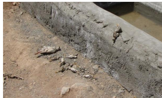
۳. خفه شدن پرندگان در آبشخورهای احداث شده سازمان محیط زیست (مسعود یوسفی)

پیوست ۱. تصاویری از مراحل مختلف زادآوری، زیستگاه‌ها و تهدیدات پرندگان در استان خراسان رضوی