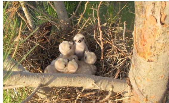
۱. جوجه پیغو در شهرستان سبزوار (مسعود یوسفی)