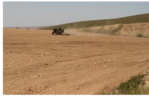
۵. تبدیل زمین‌های اطراف رودخانه‌ها به زمین کشاورزی تهدیدی برای پرندگان وابسته به رودخانه‌ها (علی خانی) ۶. کلنی لانه چلیچله رودخانه ای در سرخس (علی خانی) ادامه پیوست ۱. تصاویری از مراحل مختلف زادآوری، زیستگاه‌ها و تهدیدات پرندگان در استان خراسان رضوی.