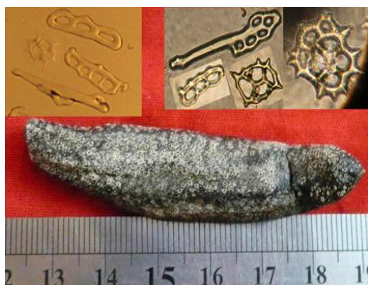
شکل ۴. Holothuria insignis

گونه‌ای با اندازه تقریبی ۲۰cm و بدن نسبتاً استوانه‌ای که تا حدودی در بخش شکمی تخت شده است. دیواره بدن نسبتاً ضخیم نرم و در نمونه‌های تثبیت شده اغلب دارای چین‌خوردگی‌های فراوان است. رنگ نمونه‌های زنده قهوه‌ای - صورتی است که پس از تثبیت در الکل کرم - سفید می‌شود (شکل ۵).