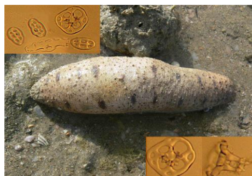
شکل ۲. Holothuria arenicola

گونه‌ای با اندازه تقریبی ۲۰cm، بدن نسبتاً استوانه‌ای که تا حدودی در بخش شکمی تخت شده است. دیواره بدن نسبتاً ضخیم نرم و در نمونه‌های تثبیت شده اغلب دارای چین‌خوردگی‌های فراوان است. رنگ نمونه‌های زنده سیاه - ارغوانی است که پس از تثبیت در الکل قهوه‌ای - صورتی می‌شود (شکل ۳).