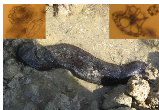
شکل ۳. Holothuria leucospilota