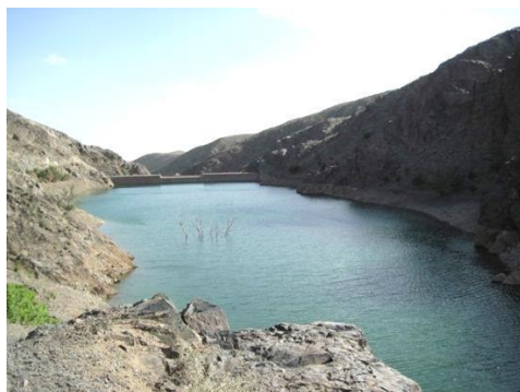
شکل ۵. ایستگاه سد در روستای مهوید (شهرستان فردوس)، زیستگاه B. oblongus