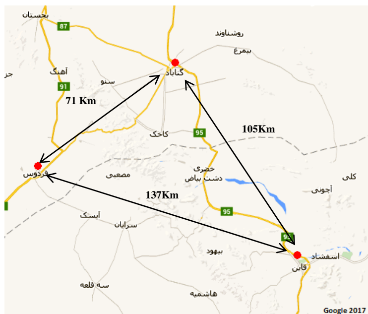
شکل ۱. شکل دایره، شهرستان‌های مورد مطالعه در این تحقیق همراه با فاصله مکانی

تکوین لاروها، به‌طور هفته‌ای و با کمک دماسنج معمولی استاندارد، اندازه‌گیری شد. تمامی نمونه‌های بالغ، در شب و با کمک دست جمع‌آوری شدند. نمونه‌های نابالغ، در درون فرمالین پنج درصد و انواع بالغ پس از کشته شدن توسط کلروفرم و تزریق فرمالین در داخل بدن، داخل فرمالین ده درصد تثبیت شدند. شناسایی نمونه‌ها با کمک منابع معتبر و با کمک صفات ریختی انجام شد (Balouch & Kami, 1995). به منظور بررسی شیب تغییرات ریختی حاصل از دگرذیسی لارو این گونه، تعداد هشت صفت و برای مطالعه صفات