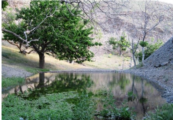
شکل ۷. چشمه فصلی (روستای مهوید)، زیستگاه B. oblongus

(شکل‌های ۷ و ۸). دمای ثبت شده از این چشمه، بین ۱۶ تا ۱۸ درجه سانتی‌گراد، متغیر بود.