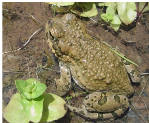
شکل ۳. جنس نر Bufo oblongus