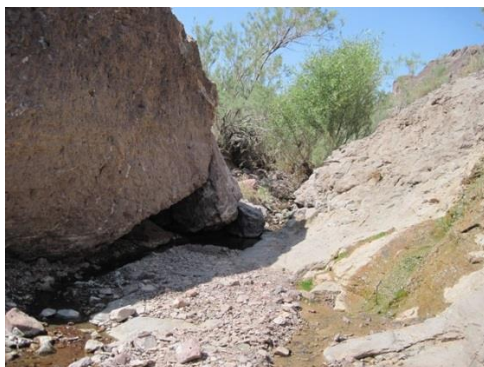
شکل ۶. ایستگاه قنات در روستای کوران (شهرستان فردوس)، زیستگاه B. oblongus