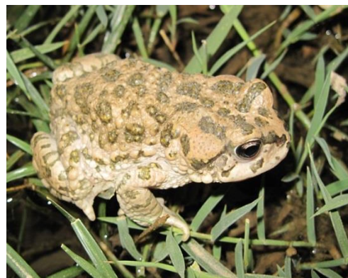
شکل ۴. جنس ماده Bufo oblongus