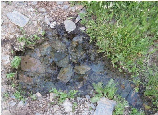
شکل ۸. چشمه فصلی (روستای مهوید)، محل تخم‌ریزی B. oblongus

در مطالعه ریختی نمونه‌های بالغ، بیشترین طول به دست آمده برای این گونه، ۸/۲۷ سانتیمتر برای جنس ماده (از ایستگاه قنات بَلَدَه باغستان علیا، شهرستان فردوس) و کمترین طول به دست آمده به میزان ۵/۵۹ سانتیمتر مربوط به جنس نر (از ایستگاه قنات قَصَبَه، شهرستان گناباد) بود. دیگر نتایج به دست آمده از مطالعه ریختی این گونه، در جدول ۶ نشان داده شده است. نسبت طول ساق پا به اندازه بدن (T/L)، بین ۰/۳۱ تا ۰/۳۸ متغیر بود؛ این نسبت در جنس ماده و نر، تفاوت اندکی نشان می‌داد (۰/۳۴). برای هفت وزغ ماده و ۰/۳۵ برای هفت وزغ نر. به