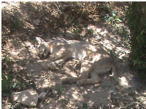
شکل ۱. کاراکال تلف شده در اثر جراحت ناشی از سیخ تشی

در این مطالعه جمعاً ۶ مورد تلفات کاراکال مستند شد که مهمترین علت تلفات، تصادفات جاده‌ای بود (۳ مورد از ۶ مورد). دلیل مرگ یک قلاده کاراکال نامشخص، یک مورد مصرف طعمه مسموم و مورد دیگر جراحت ناشی از برخورد سیخ‌های تشی بوده است.