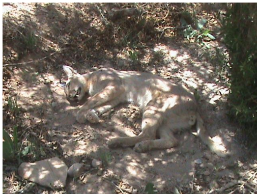
شکل ۱. کاراکال تلف شده در اثر جراحت ناشی از سیخ تشی

در این مطالعه جمعاً ۶ مورد تلفات کاراکال مستند شد که مهمترین علت تلفات، تصادفات جاده‌ای بود (۳ مورد از ۶ مورد). دلیل مرگ یک قلاده کاراکال نامشخص، یک مورد مصرف طعمه مسموم و مورد دیگر جراحت ناشی از برخورد سیخ‌های تشی بوده است.