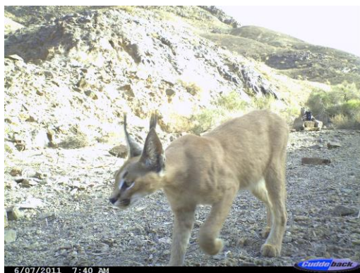
شکل ۲. کاراکال در پارک ملی سیاهکوه.

استان یزد به دست آمد. این تعداد رکورد شامل ۳۶ تصویر به دست آمده از دوربین‌گذاری تله‌ای در ۳ منطقه تحت مدیریت محیط زیست در استان یزد، ۵۴ مورد مشاهده مستقیم کاراکال در نقاط مختلف استان و ۶ مورد لاشه کاراکال تلف شده بود. بر اساس مشاهدات مستقیم ثبت شده انتشار کاراکال در پارک ملی و منطقه حفاظت شده سیاهکوه اردکان، منطقه حفاظت شده کالمندها-بهداران مهریز، منطقه شکارممنوع آریز بافق، منطقه شکارممنوع مرور میبد، پناهگاه حیات وحش نایبندان طبس، منطقه حفاظت شده باغ شادی خاتم، شهرستان تفت: جاده یزد-دهشیر (۵ کیلومتری قبل از دهشیر) و پشتکوه، شهرستان ابرکوه: کیلومتر ۴۵ جاده ابرکوه - مروست و شهرستان مهریز: کیلومتر ۵۸ جاده مهریز- خاتم قطعی است. خلاصه نتایج دوربین‌گذاری‌های تله‌ای در جدول ۱ آمده است. بر اساس جدول یادشده علیرغم اینکه در پناهگاه حیات وحش نایبندان تلاش دوربین‌گذاری بیشتر بوده اما بیشترین تصویر کاراکال از پارک ملی و منطقه حفاظت شده سیاهکوه به دست آمده است. در مجموع شاخص فراوانی نسبی کاراکال در ۳ منطقه دوربین‌گذاری شده با لحاظ میزان تلاش دوربین‌گذاری، در پارک ملی و منطقه حفاظت شده سیاهکوه بیشترین بود.